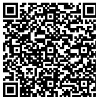
QR Code de Clohars-Fouesnant

Scannez le QR Code via le lecteur intégré